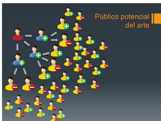
Público potencial del arte

serie de contactos, la página o los contenidos que en ella aparecen. Este es el caso de las API de Facebook que permiten, entre otras cosas, poder utilizar el famoso botón "me gusta" ( like ) en otras páginas web 4 . También, existe la opción de realizar una publicación acerca de dicho sitio mediante los enlaces, gracias al "marketing viral" de las redes sociales que permite que sea visible para todos nuestros contactos. Acciones que, por lo general, con algunas excepciones, suelen estar encaminadas a la difusión positiva de determinada información que nos gustaría que nuestros amigos conozcan y, al mismo tiempo, compartan.